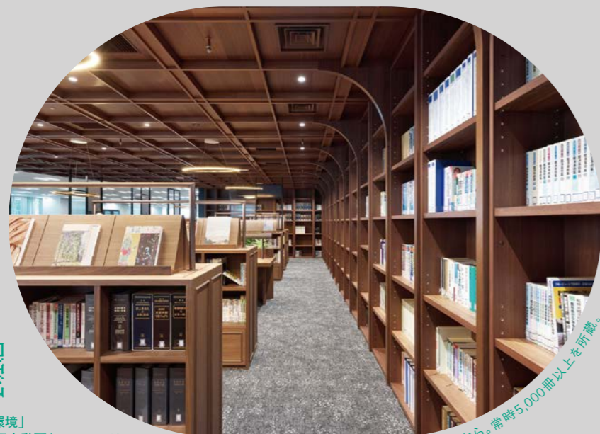
ライブラリー | 技術の研鑽は日々の学びから。常時5,000冊以上を所蔵。