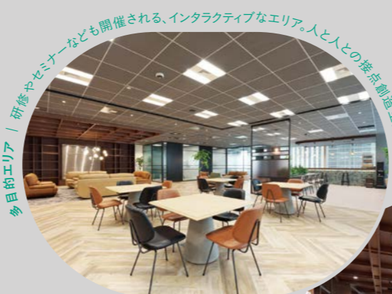
多目的エリア | 研修やセミナーなども開催される、インタラクティブなエリア。人と人との接点創造空間。