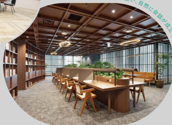
ラウンジ | 偶発的な出会い、自然に会話が発立する環境。